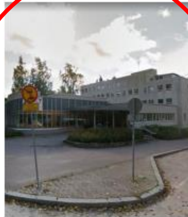
Toimintakeskus Kaupungin koordinoima yhdistysten talo