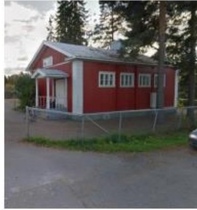
Kinnari D Luovutaan