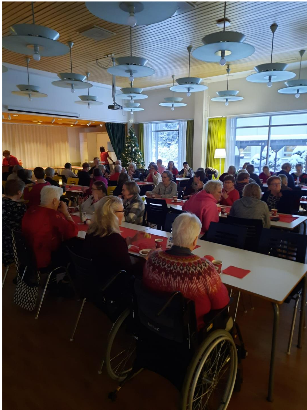
Joulujuhla Myllytiellä 8.12.2022