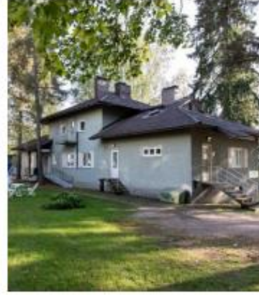
Ent. Työterveysasema Yhdistysten koordinoima yhdistysten talo