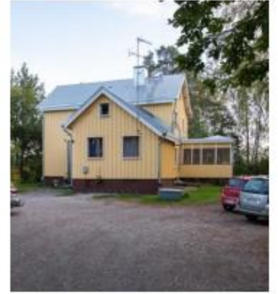
Seppälän talo Yhdistysten koordinoima yhdistysten talo