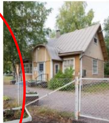
Sahan koulu Luovutaan