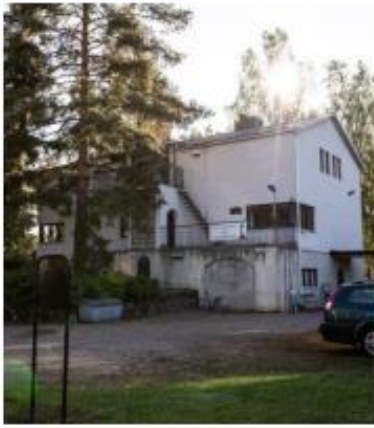
Valtuustokatu 8 Luovutaan

Aikataulu täsmentyy suunnittelun yhteydessä. Nopeita muutoksia minkään tilan osalta ei ole tulossa.