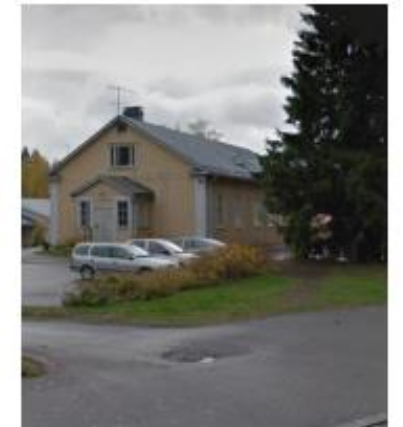
Haarajoen puukoulu Luovutaan