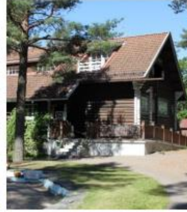
Villa Cooper Luovutaan