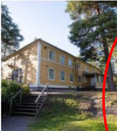
Seuratalo Yhdistysten talo