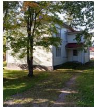
Valtuustokatu 3 Luovutaan